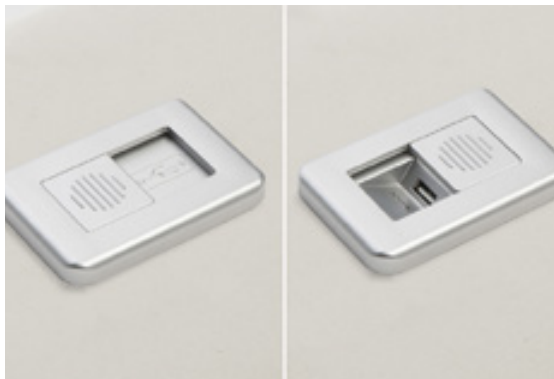
USB charger - exclusives Ladegerät