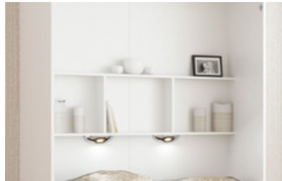
"H" - Regal