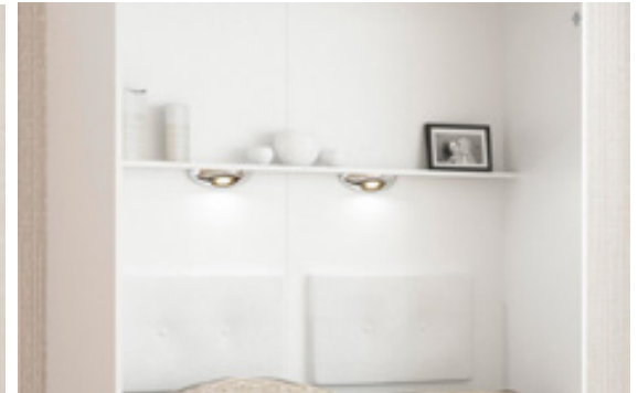
"I" - Regal