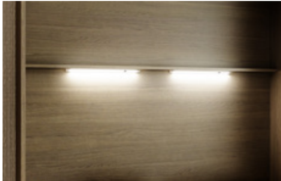
Led 40 - zwei einzeln einschaltbare Lampen mit integriertem Switch und Dimmer Funktion.